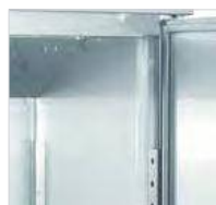
Ângulos arredondados para uma limpeza mais fácil.