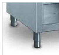
Pés reguláveis em altura.