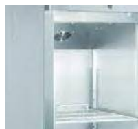
Estrutura interna e externa em aço inoxidável.