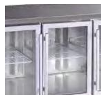
Porta de vidro e luz LED.