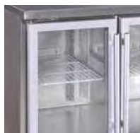
Uma prateleira por porta.